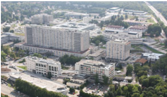
Site des hôpitaux de Brabois

CHU de Nancy, 29 av Maréchal de Lattre de Tassigny, CO 60034 - 54035 Nancy Cedex Tél : 03 83 85 85 85 Site Internet : http://www.chu-nancy.fr