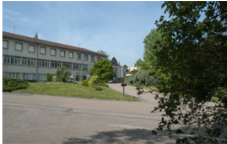
Centre pour enfants Flavigny