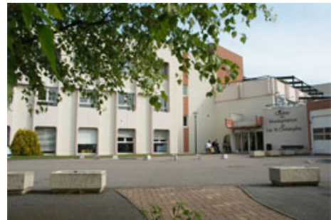
Centre de Lay-Saint-Christophe

- recherche : équipe constitutive de l'Institut Fédératif de Recherche sur le Handicap (IFR25 - INSERM) dont la thématique principale concerne les processus de compensation et d'adaptation face au handicap. L'IRR gère la première base de données documentaire française en réadaptation.