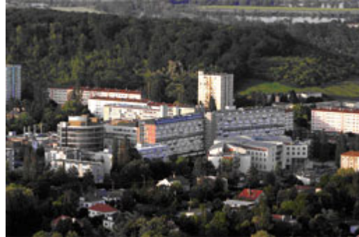
Hôpital Bel-Air (Thionville)

Issu en 1977 de la réunion entre le CH de Metz et le CH de Thionville, le CHR Metz-Thionville est l'établissement public de santé de référence du territoire Nord Lorrain. La zone d'attraction du CHR Metz-Thionville (environ 600 000 habitants) se caractérise par des bassins de population denses. Avec 120 798 séjours en 2010 , le CHR se situe en France au 12 e rang en terme d'activité médicale ( Base CHU Montpellier ).