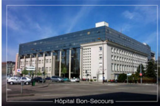
Hôpital Bon-Secours (Metz)