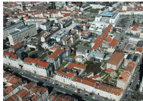
Site des hôpitaux urbains

Centre Hospitalier Universitaire de référence en Lorraine, le CHU de Nancy est un établissement public de santé. Plus gros employeur du département de Meurthe et Moselle, près de 9000 personnes y travaillent. Acteur majeur de la recherche biomédicale doté de plateaux techniques performants (blocs opératoires, imagerie, laboratoires, explorations fonctionnelles), l'établissement hospitalo-universitaire lorrain travaille en étroite collaboration avec l'Université Henri Poincaré tant pour la recherche que pour la formation initiale et continue des professionnels de santé.