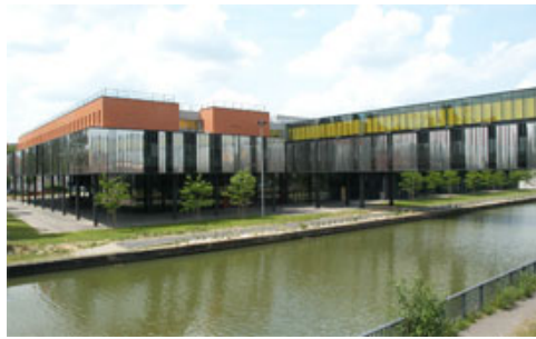
Centre de Nancy « Louis Pierquin »

Créé en 1953, l'IRR est constitué d'un ensemble de services et de centres chargés d'appliquer les techniques de médecine physique et de réadaptation (MPR) dès la phase aiguë de l'installation des lésions, en vue de permettre la meilleure réinsertion sociale et professionnelle possible des personnes handicapées ou susceptibles de le devenir.