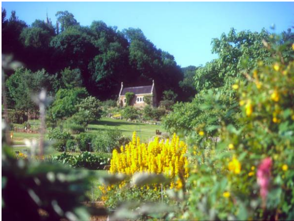
Chapelle St Valérie, jardin botanique du Montet (2007) Chapelle St Valérie, jardin botanique du Montet (1975)