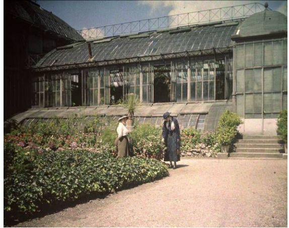
Serres et visiteuse, jardin historique Nancy 1910