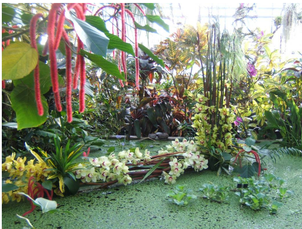
Exposition « Orchidées 2006 », décor dans le bassin de la serre du jardin botanique du Montet