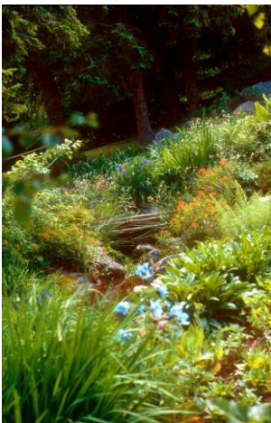
Le jardin d'altitude du Haut Chitelet