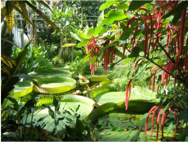
Bassin de la serre du jardin botanique du Montet